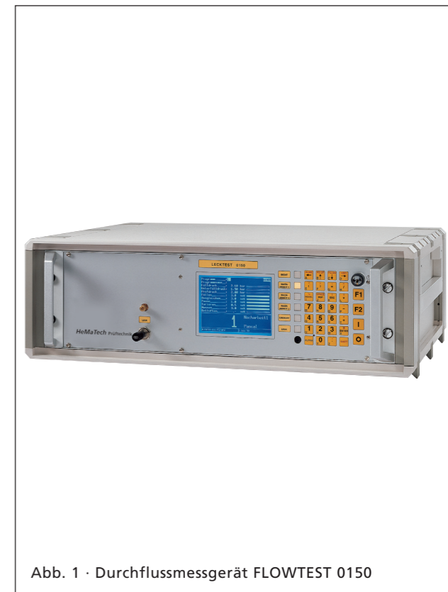
Abb. 1 · Durchflussmessgerät FLOWTEST 0150